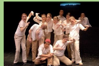
"Children playground trees" "Laramie (010)"